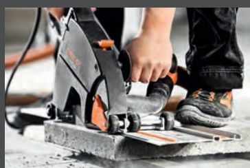
System cięcia i szlifowania Czysta sprawa – bezpyłowa praca w systemie od strony 120