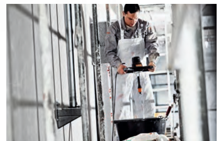
Mieszanie Ergonomiczne, trwałe i silne. Do wszystkich materiałów i ilości.