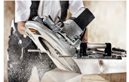
Obróbka drewna Silne, wytrzymałe, precyzyjne.