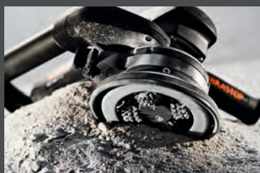
RenoFix Asy renowacji od strony 58