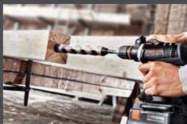
QuaDrive Najszybsze wkrętarki na rynku od strony 16