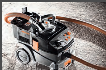
Odkurzacze PROTOOL Przeznaczone na plac budowy od strony 88