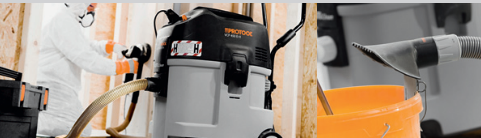
VCP 450 E-H