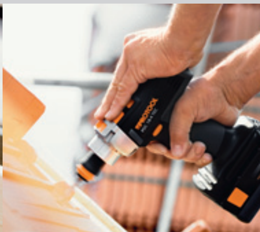
QuaDrive IDC 15-2 TEC LI / IWC 18-2 TEC LI