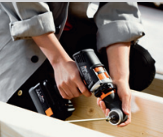
QuaDrive DRC/PDC 15-4 TEC LI

Nowa generacja akumulatorowych narzędzi do wiercenia i wkręcania: QuaDrive.