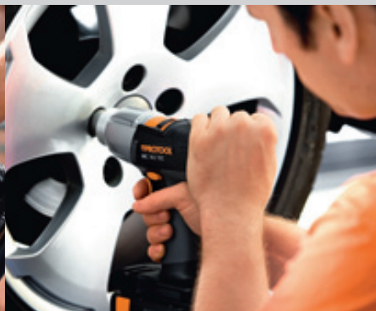
QuaDrive DRC/PDC 15-4 TEC LI SET