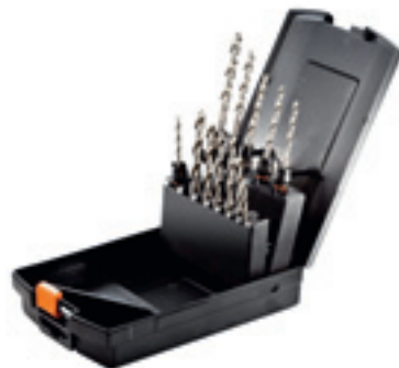
Zestaw do metalu CENTROTEC „METAL” Zestaw w kasetce do SYS-BS Cordless