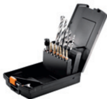
Zestaw do drewna CENTROTEC „WOOD” Zestaw w kasetce do SYS-BS Cordless