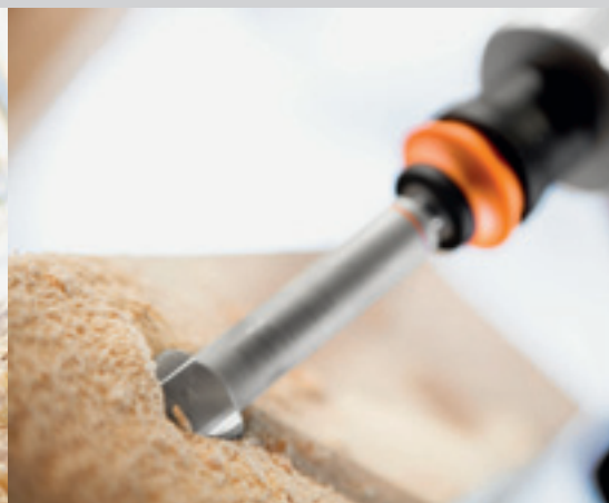
ZOBO CENTROTEC SET

NOWOŚĆ: wiertła ZOBO z systemem szybkiej wymiany