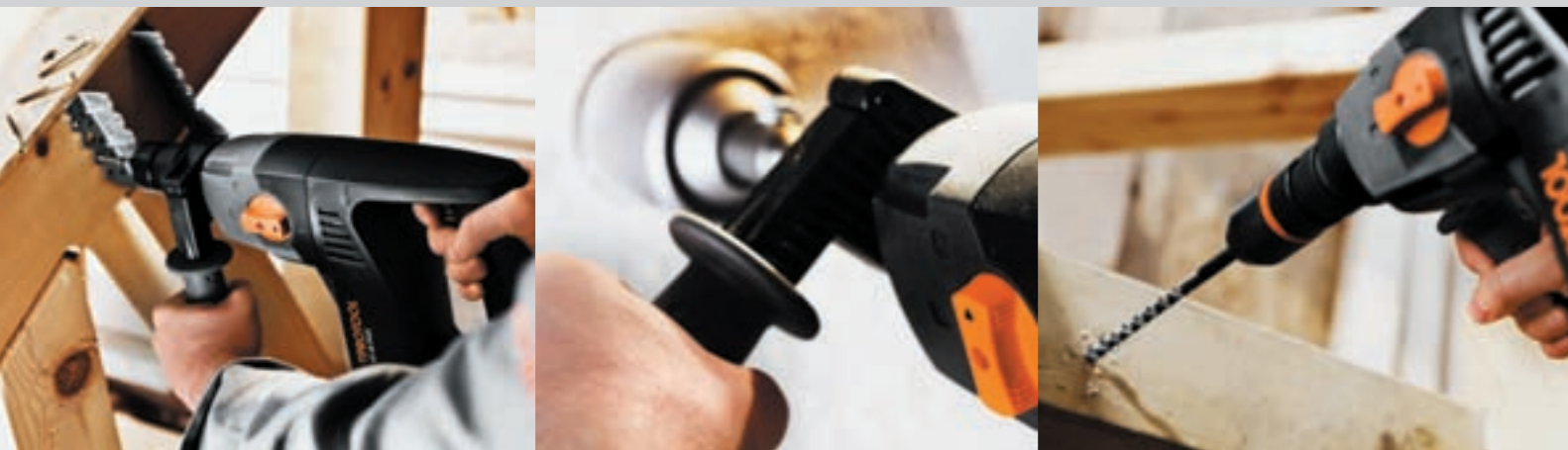
Adapter do uchwytu wiertarskiego